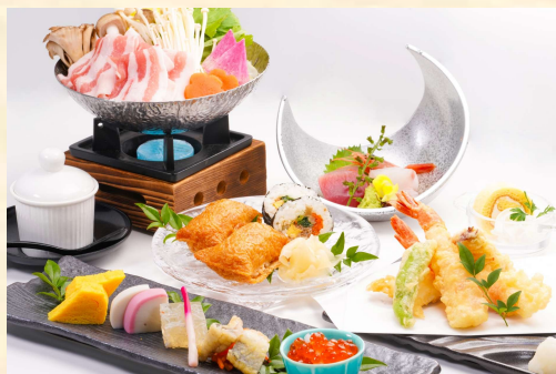
和食ランチコース 4,400円