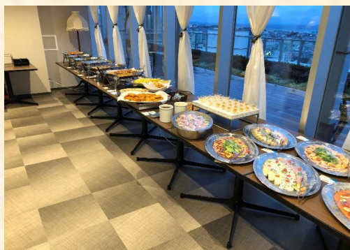
ブッフェランチコース (30名様より) 4,400円