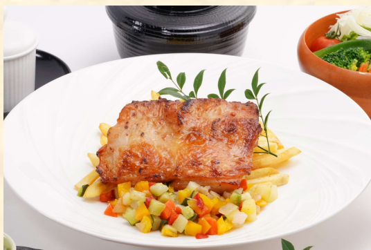
ローストチキンランチコース 3,300円