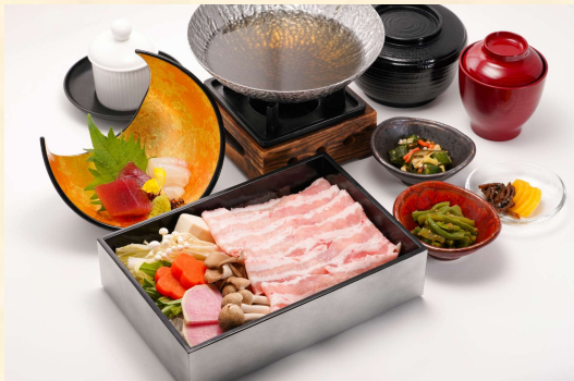
しゃぶしゃぶランチコース 3,300円